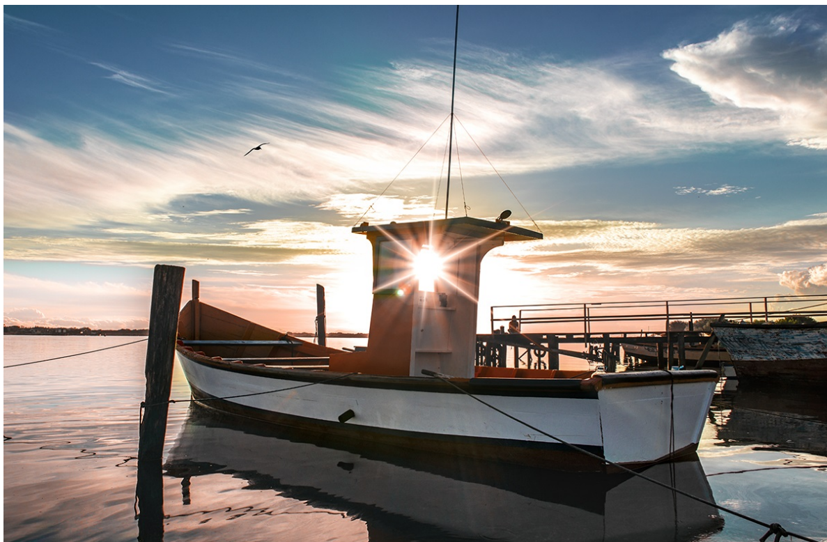
Lagoa dos Patos, Praia do Laranjal, Pelotas, Rio Grande do Sul.