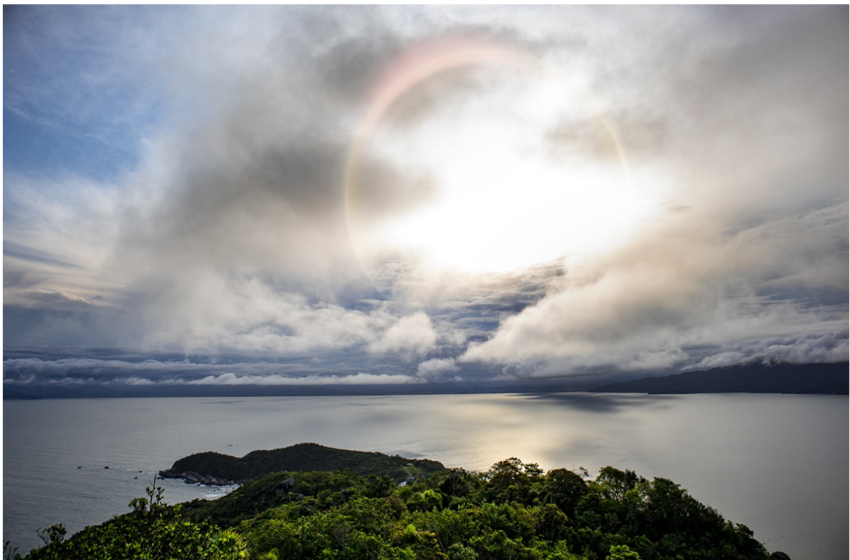
Parque Natural Municipal do Morro do Macaco, Bombinhas, Santa Catarina.

Dossiê Especial: Sociedade, Poder e Globalização