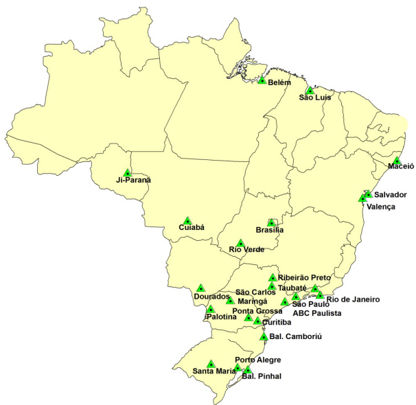
FIGURA 6. Projetos carroceiros existentes nas universidades brasileiras.