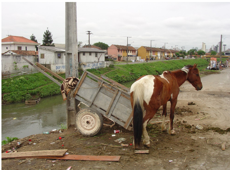
Figura 3. Cavalo de carroceiro de material reciclável privado de alimentação, água e movimentação, junto à sua carroça, em Curitiba, Paraná.