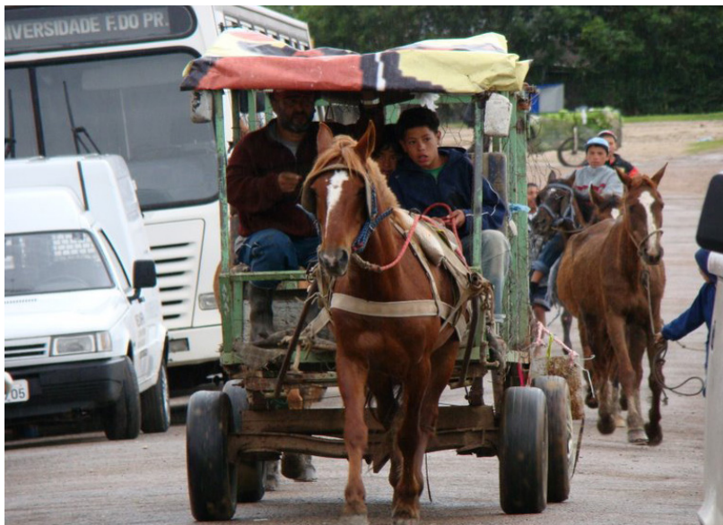
Figura 5. Projeto Carroceiro da UFPR. Cada sociedade deve optar pela regulamentação ou proibição da atividade, destino dos cavalos e alternativas profissionais para os carroceiros. Mas as universidades têm tido papel importante na ajuda aos carroceiros e seus cavalos e no bem-estar de ambos.