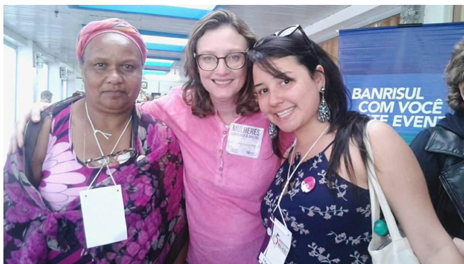
Figura 6. Conferência Estadual de Políticas Públicas para Mulheres, 2015.

Os debates do eixo que estávamos, ficaram centrados nas seguintes questões; fundo partidário para as mulheres; lideranças partidárias trabalhando para os homens; mulheres votando mais, mas não se elegendo; fortalecimento das frentes feministas; autonomia dentro das organizações; defesa da presidenta Dilma contra os ataques patriarcais e machistas; reforma política; recursos e formação/capacitação destinada às mulheres através dos partidos.