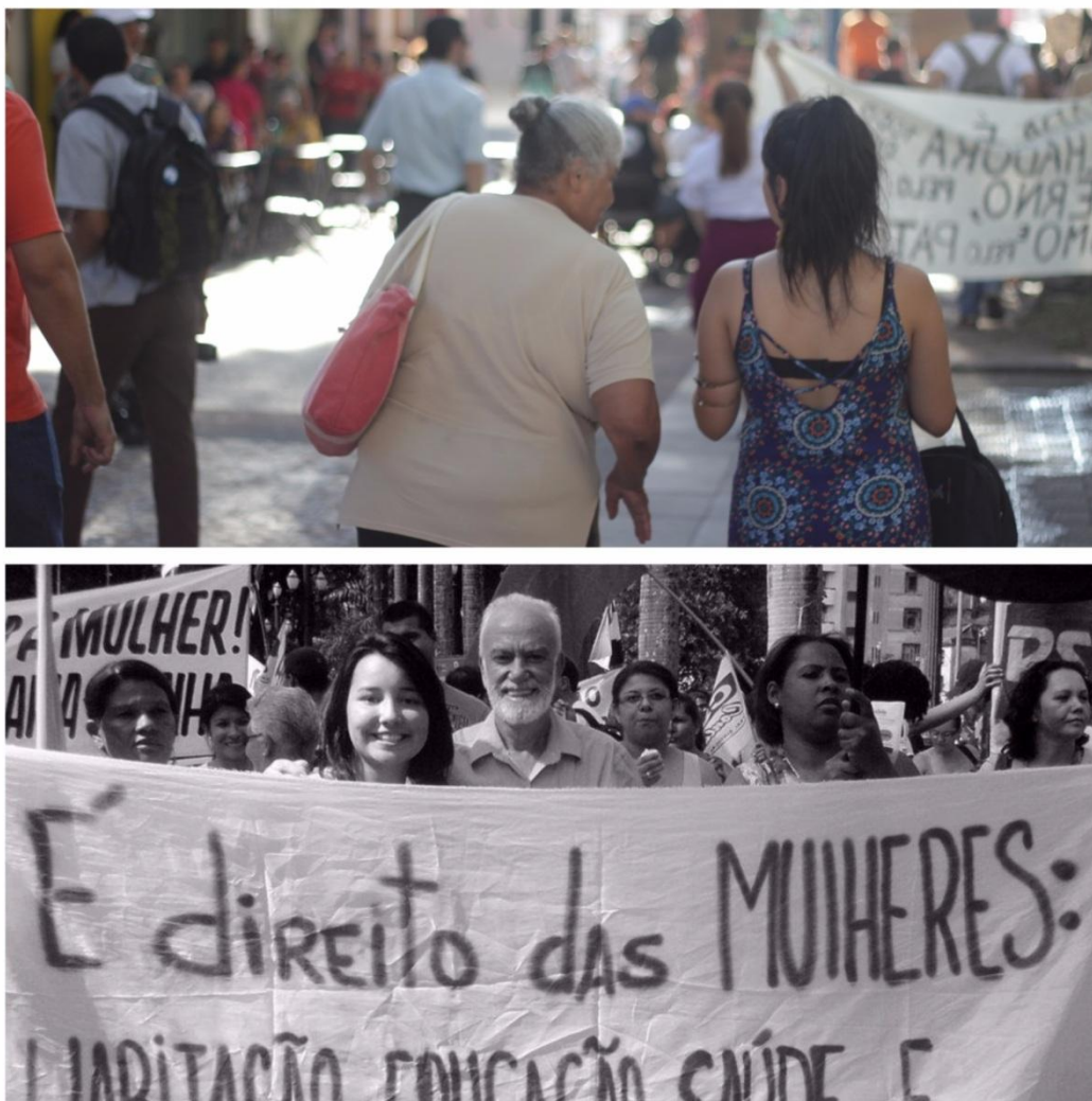
Figura 17. Marcha das Mulheres, 2014-2015.