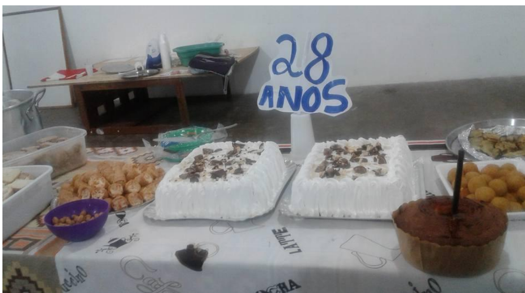
Figura 18. Comemoração, 28 anos do Sindicato das Trabalhadoras Domésticas de Pelotas, 22 de junho de 2017.