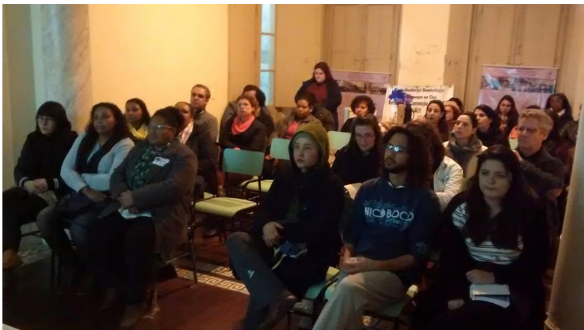
Figura 15. Atividade “Discutindo Trabalho Doméstico e Patrimônio” SECULT 15/09/2016.