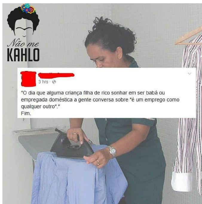
Figura 5. 10

Nas redes sociais, através do facebook, surgiu a campanha de uma trabalhadora doméstica negra que se tornou médica, com o lema “A CASA GRANDE SURTA QUANDO A SENZALA VIRA MÉDICA.” Diversas mulheres que eram trabalhadoras domésticas, deixaram de ser, para irem em busca de profissões com melhor remuneração. O Exame Nacional do Ensino Médio (ENEM) tem sido um dos mecanismos utilizados pelas trabalhadoras domésticas para a inserção em cursos superiores. E, dessa forma, o ingresso em trabalhos fora do âmbito doméstico.