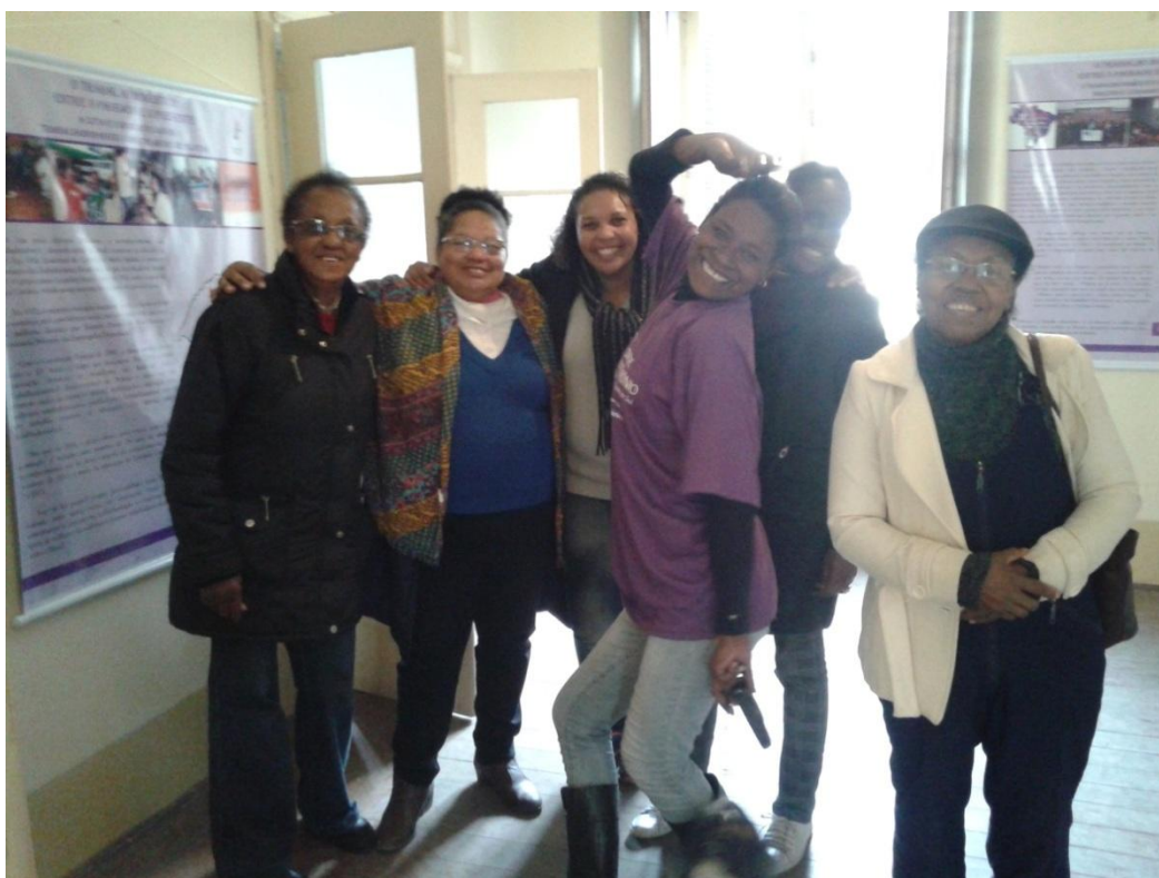
Figura 12. Exposição Dia do Patrimônio, 2016.