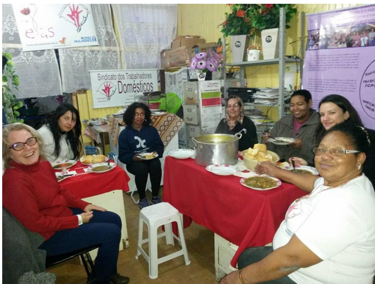
Figura 16. Reunião com Sindicato, 2014.