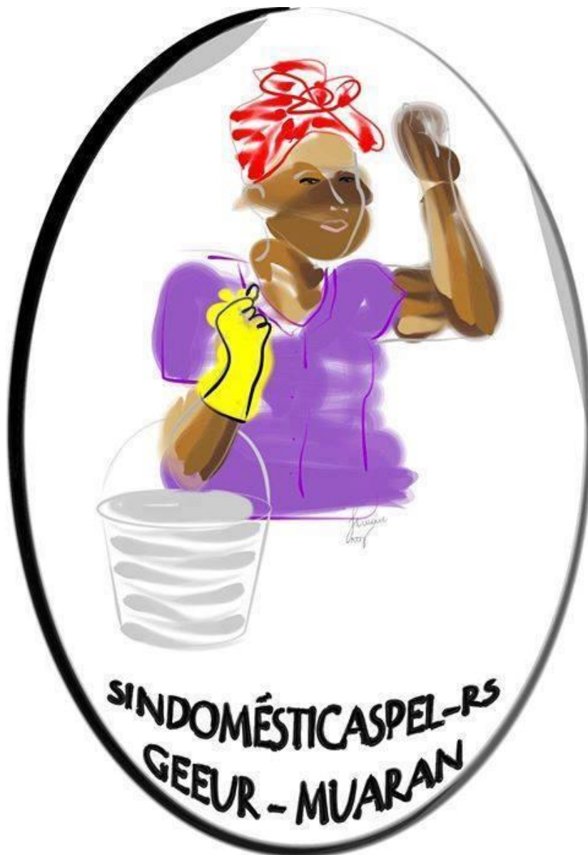
Figura 1. 1