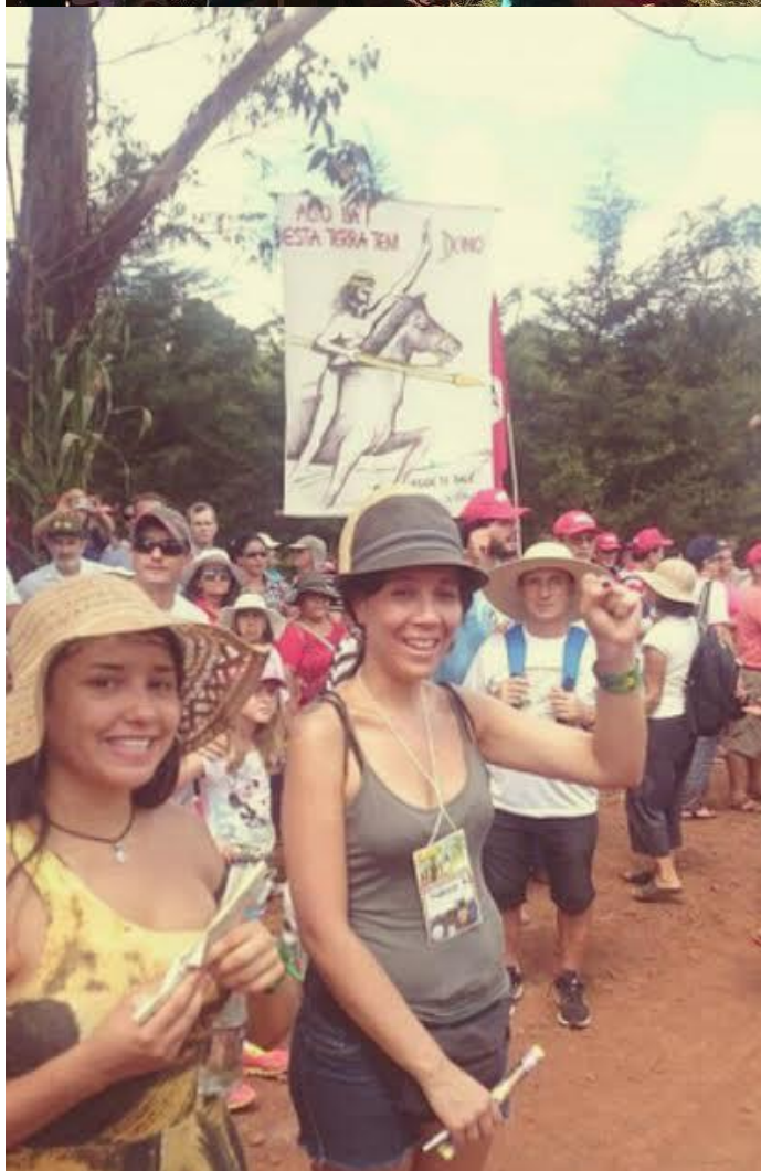
Figura. 9-10, Romaria da Terra, Pontão-RS, 2017.