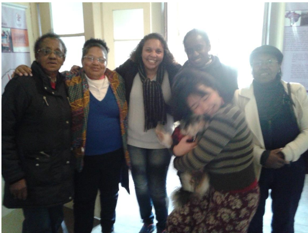
Figura 11. Exposição Dia do Patrimônio. 2016.