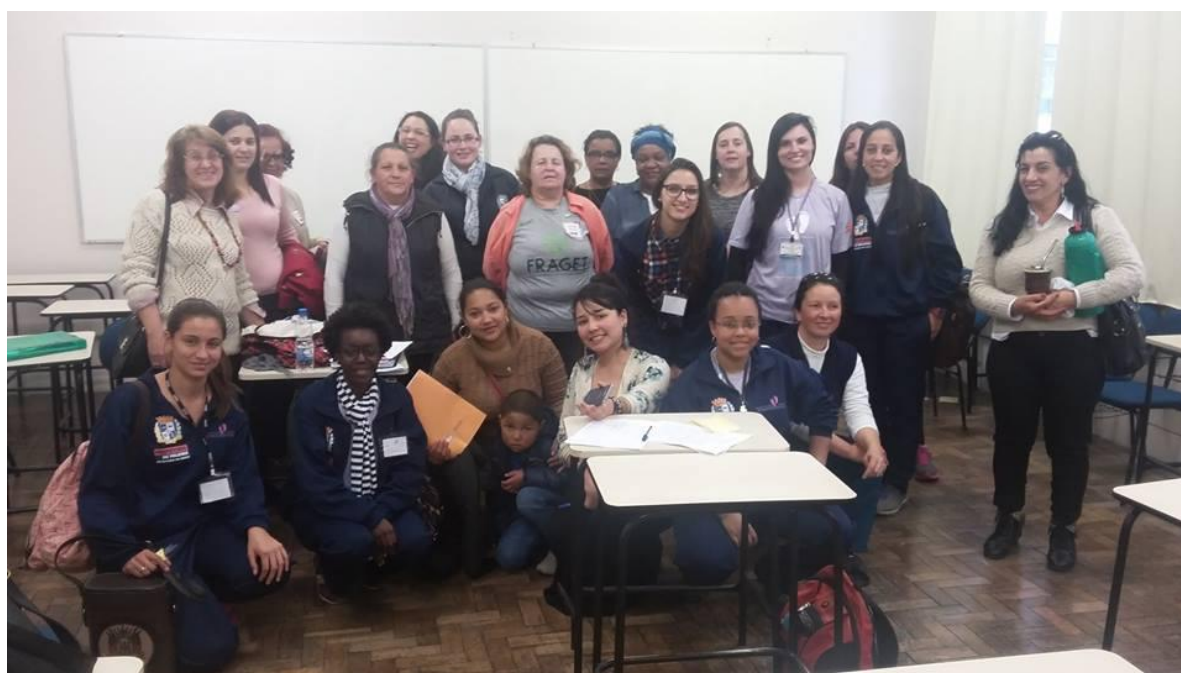
Figura 14. Conferência Estadual de Políticas Públicas para Mulheres.