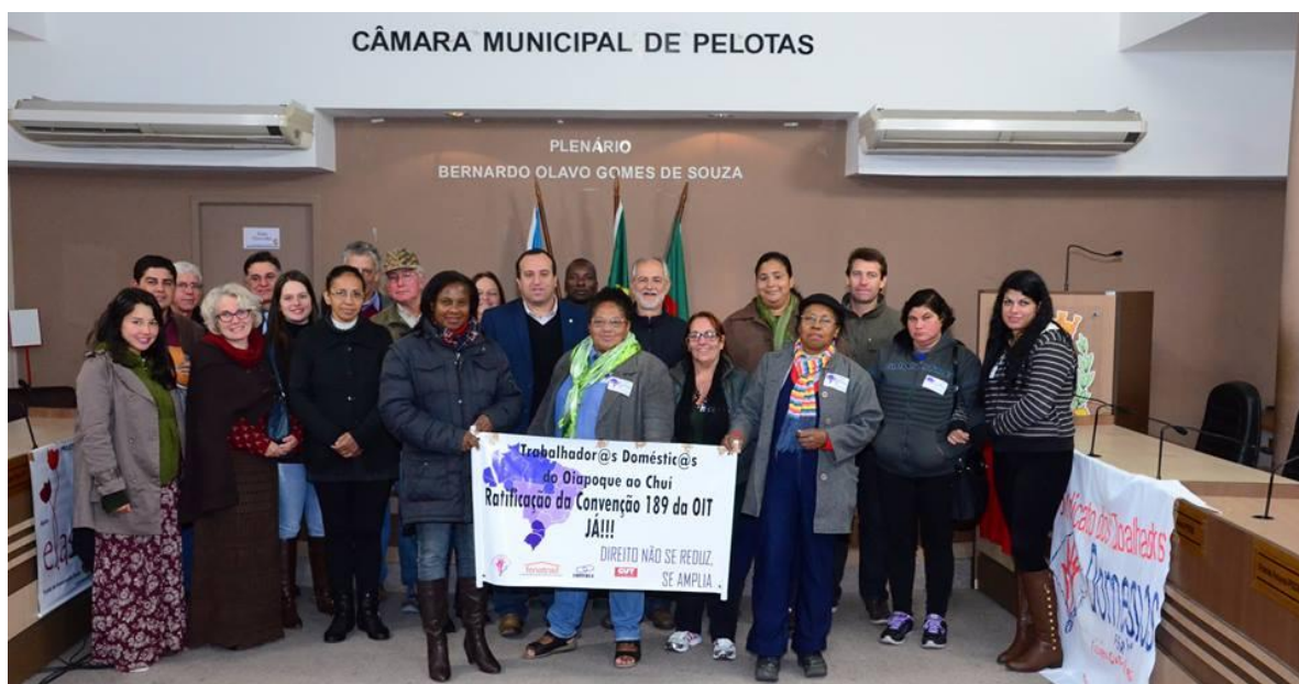
Figura 13. Dia Nacional das Trabalhadoras Domésticas, 27/03/2015.