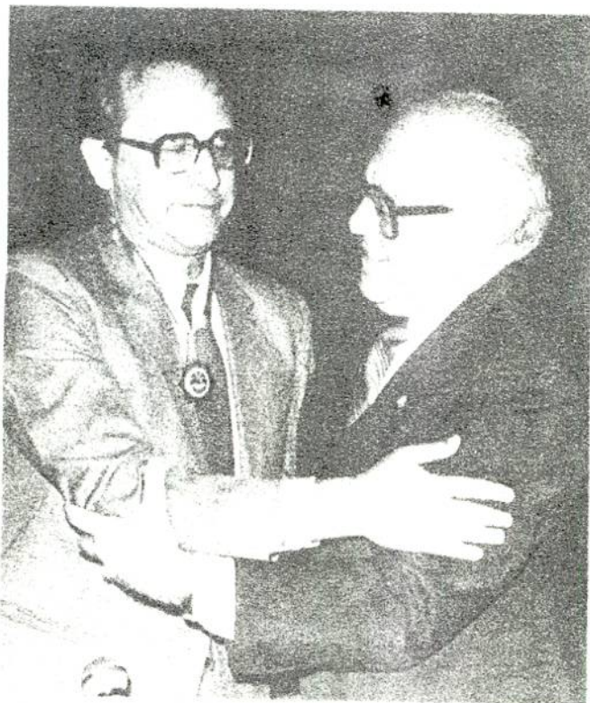
O Reitor e o homenageado