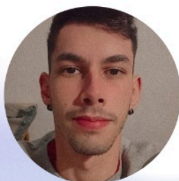
João Vitor JotaCê Turismo